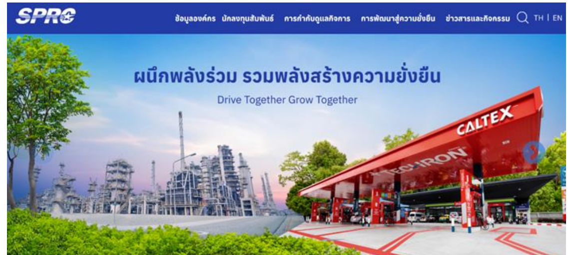
หน้าการพัฒนาสู่ความยั่งยืน

เว็บไซต์บริษัท กัลฟ์ ดีเวลลอปเมนต์ จำกัด (มหาชน)