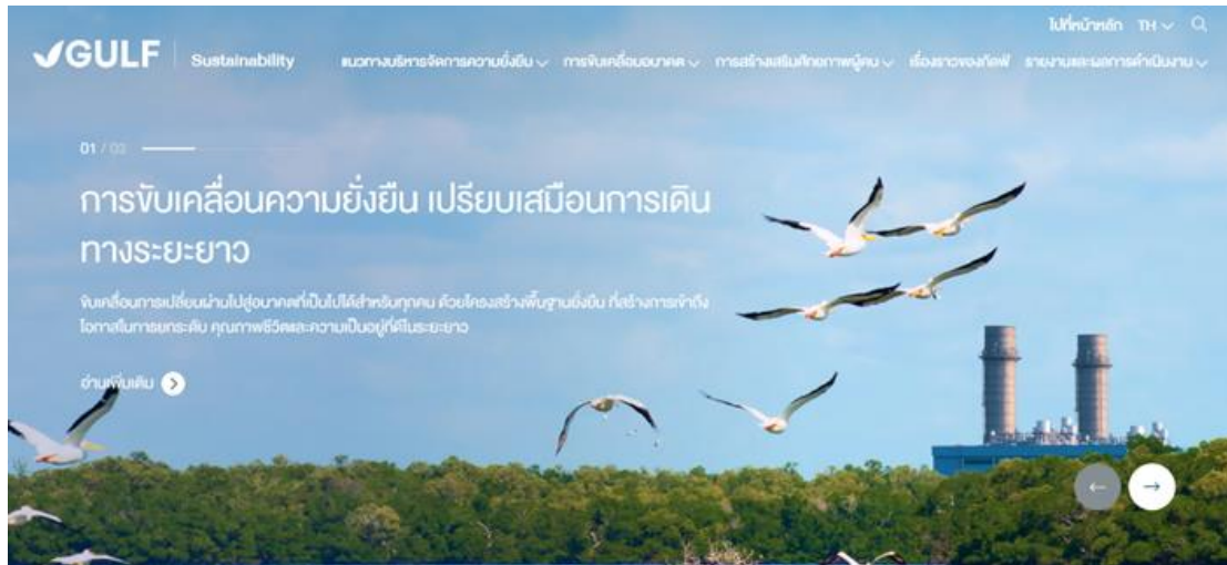
หน้าความยั่งยืน

เว็บไซต์บริษัท กัลฟ์ ดีเวลลอปเมนต์ จำกัด (มหาชน)